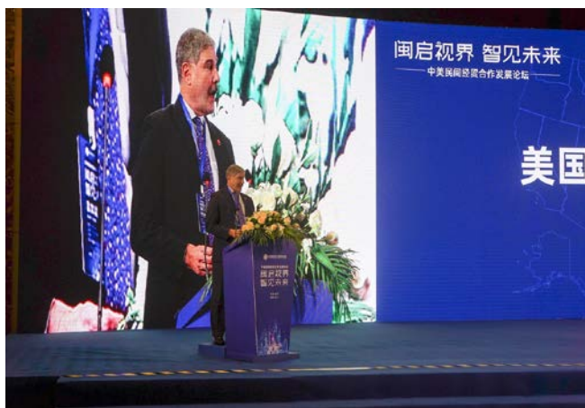
U.S. Consul General Jim Levy delivered welcome remarks at the event