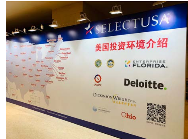
SelectUSA Exhibition Areas for EDOs and Service Providers